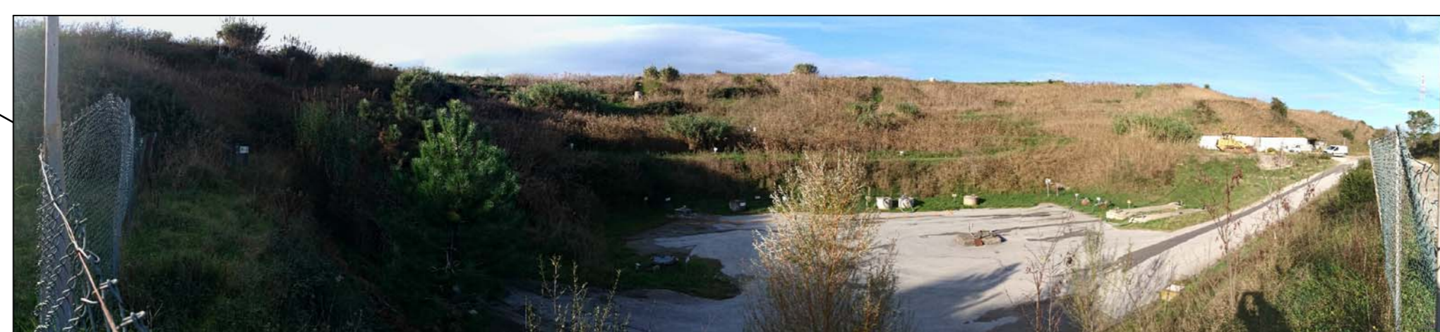
Zona "Anfiteatro". A seguito di lavori di implementazione delle vasche del percolato, lo stato dei luoghi e le reti/sottoservi potrebbero risultare diversi e dovranno essere verificati dall'Impresa prima dell'inizio dei lavori

NAMPS Azienda Ambientale di Pubblico Servizio S.p.A.